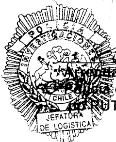
Arrendatario Carabineros de Chile JEFATURA DE LOGISTICA RUT N° 60.506.000-5